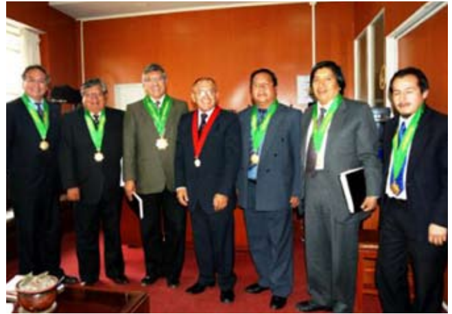
El Presidente de la Corte Superior de Justicia de Junín, Dr. Alcibiades Pimentel Zegarra acompañado por la directiva del Colegio de Abogados.

“Es saludable este tipo de reuniones orientadas a solucionar los impases que se puedan presentar y de esa forma mejorar el sistema de justicia en el Distrito Judicial de Junín; existe el compromiso de trabajar unidos en las diferentes actividades académicas y otros; asimismo adoptaremos las medidas correctivas frente a los posibles problemas”, expresó el Dr. Alcibiades Pimentel Zegarra.