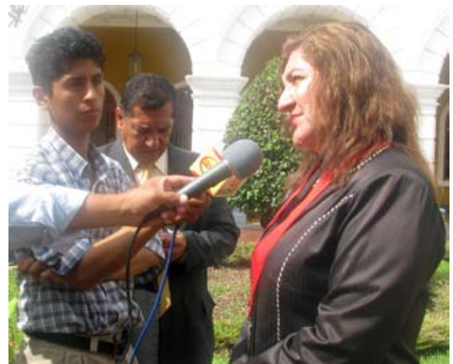
Jefa de ODECMA declara a los periodistas

“Si se detecta un acto indebido procederemos conforme a nuestras facultades para no permitir impunidad, pues la corrupción no se puede justificar de ningún modo”, dijo.