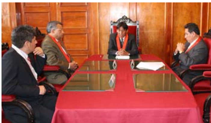
Primera sesión del Consejo Ejecutivo Distrital con sus nuevos integrantes.

Los integrantes del Consejo Ejecutivo Distrital de la Corte Superior del Cusco juramentaron a sus cargos en una ceremonia especial.