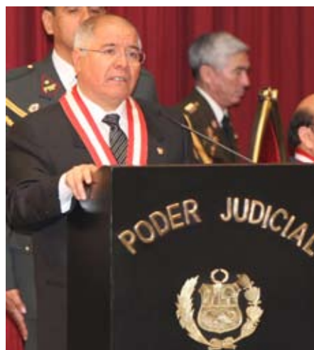
Doctor César San Martín Castro

Añadió que informar, acercar y hacerse comprender mejor por el ciudadano serán aspectos fundamentales en el quehacer del Poder Judicial. En ese contexto, explicó, impulsará la orientación al usuario en todos los distritos judiciales del país, lo cual será complementado con programas como “Justicia para Todos”, “Expojusticia” y un nuevo sitio Web denominado “Wikijudicial”.