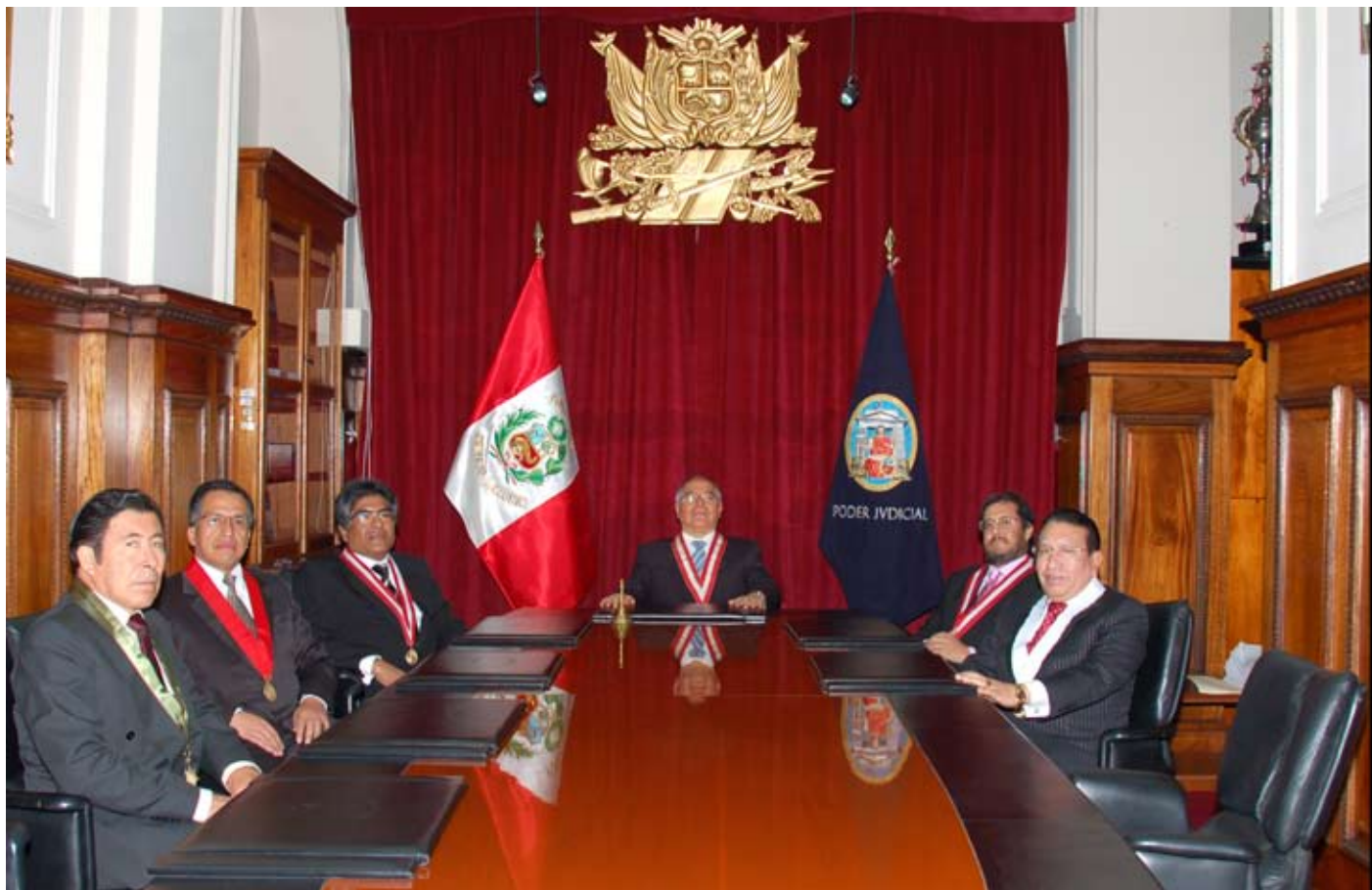
Doctor César San Martín y miembros del Consejo Ejecutivo del Poder Judicial.

Mencionó, asimismo, que trabajará con las llamadas asociaciones público -privadas para que las instituciones empresariales ayuden al Poder Judicial, en proyectos de infraestructura aprobados por el Sistema Nacional de Inversión Pública (SNIP). ■