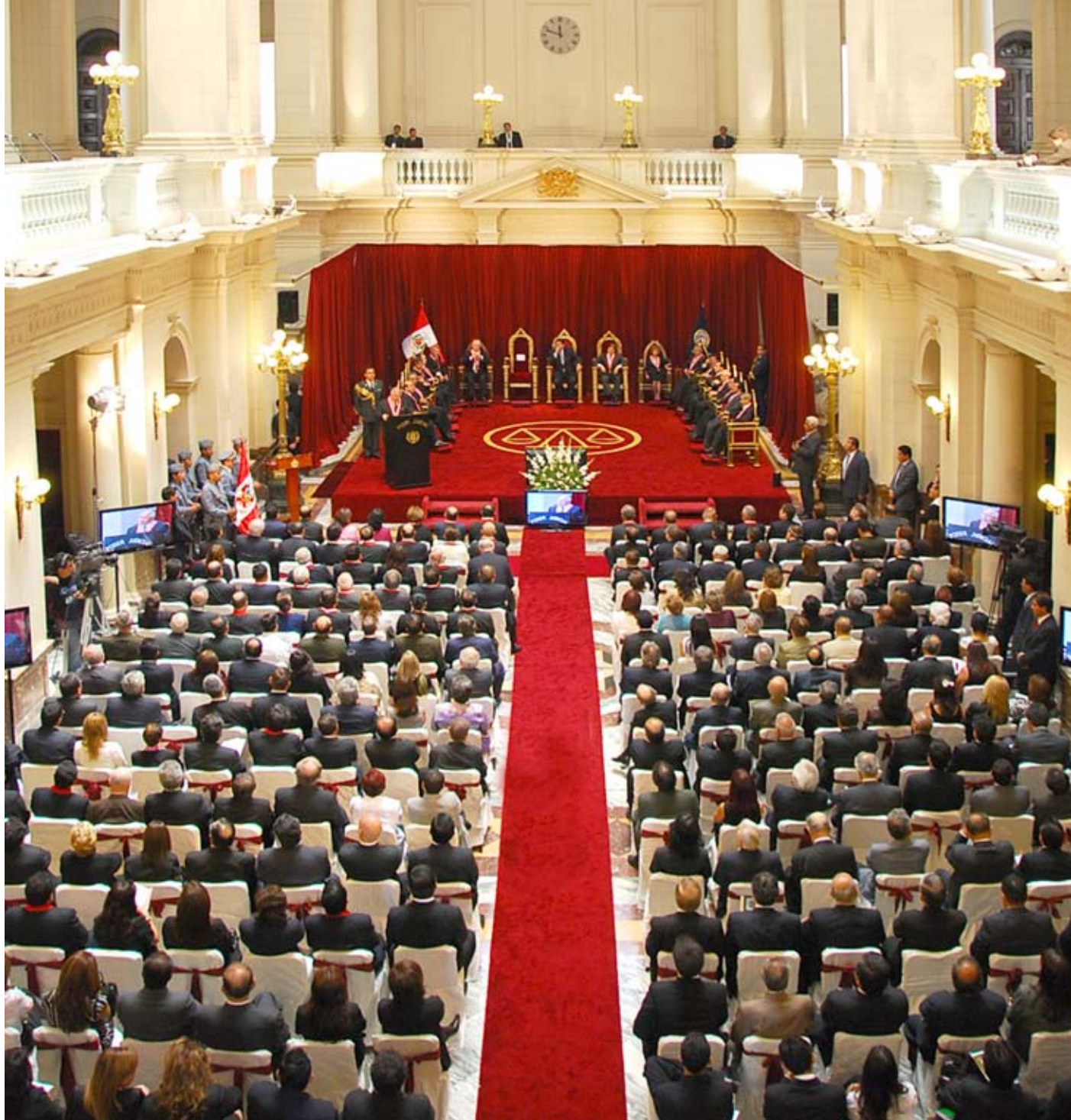
Salón Vidaurre lució un marco impresionante.