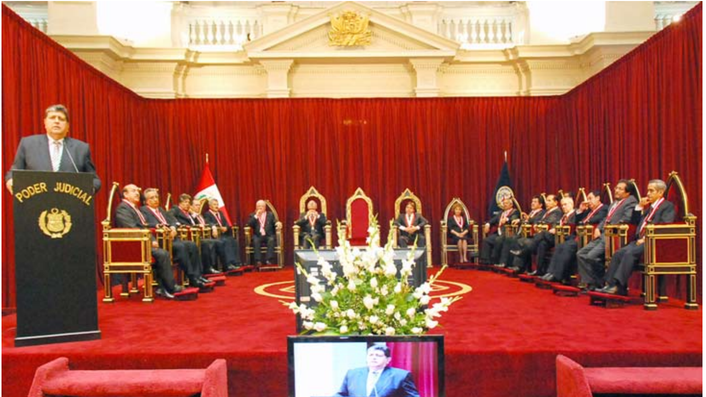
Presidente de la República destacó logros en el Poder Judicial.

Jefe de Estado pide a población apoyar esfuerzos de autoridades judiciales.