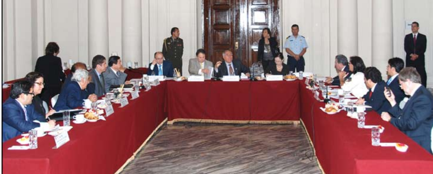
Comisión de Alto Nivel Anticorrupción tomó importantes acuerdos.