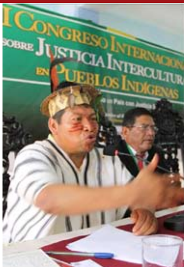
Participantes en el I Congreso Internacional de Justicia Intercultural realizado en La Merced.