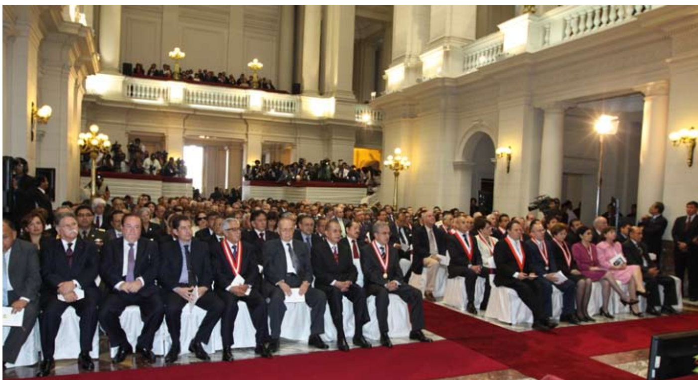
Principales autoridades de instituciones públicas asistieron al acto de asunción de cargo del nuevo Presidente del Poder Judicial.

das desde este órgano central. La participación de la sociedad civil, imperativo moral si se quiere potenciar una mayor legitimidad de nuestra labor, deberá eso sí darse respetando los parámetros legalmente establecidos al respecto. ■