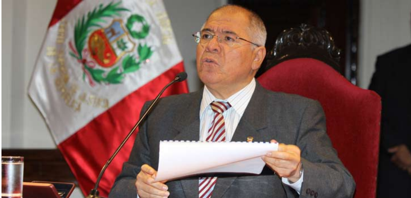
Presidente del Poder Judicial dialogó ampliamente con la prensa sobre diversos temas.