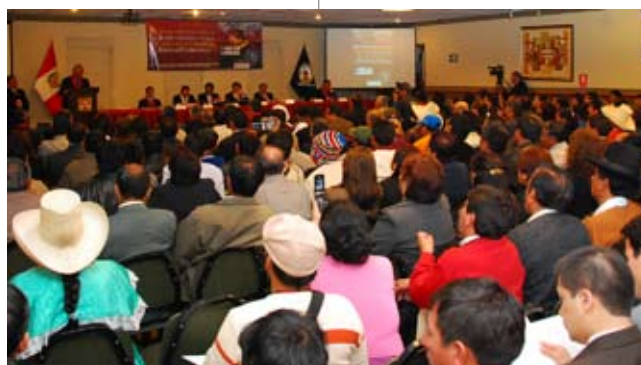
II Congreso Intercultural realizado en Cajamarca.

y valoren los beneficios de este sistema, a través de la implementación y funcionamiento de un Centro de Documentación, Información y Buenas Prácticas del Sistema de Justicia Local, de una estrategia de difusión del Sistema acompañada de materiales informativos y eventos con operadores de justicia.