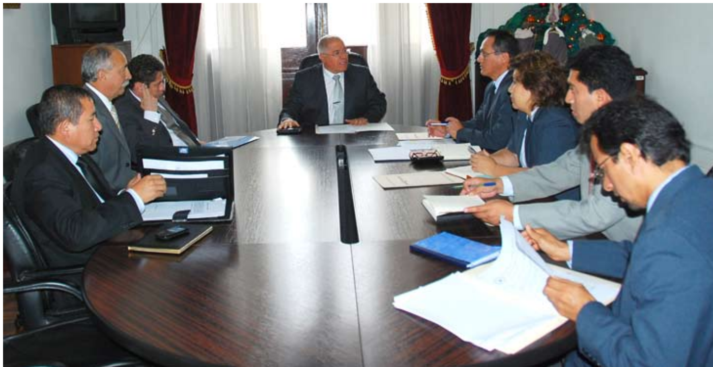
Las reuniones sirvieron para conocer puntos de vista y preocupaciones comunes.

Expresaron respaldo a nuevo titular de la Corte Suprema.